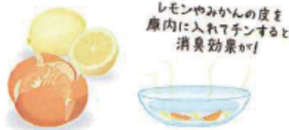
レモンやみかんの皮を庫内に入れてチンすると消臭効果が！

ボウルは熱いのでやけどに注意しましょう。また、重曹やお酢を合わせたお湯を含ませたタオルやスポンジを使えば、頑固な汚れに効果的です。さらに外側や裏側はホコリがたまりやすいので、取り除くことで、パワーダウンを防げます。