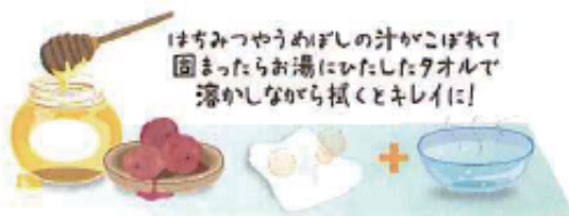
はちみつやうめざしの汁がこぼれて固まったらお湯にひたしたタオルで濡かしながら拭くとキレイに！

常に食品を入れておく場所だけに清潔にしておきたいもの。でもいっぺんに庫内全部をお掃除するのはとても大変なので今日はドアポケット、今日はこの棚1段といった感じで少しずつやれば、負担なく清潔を保てます。