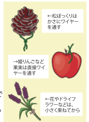
←松ぼっくりはかさにワイヤーを通す