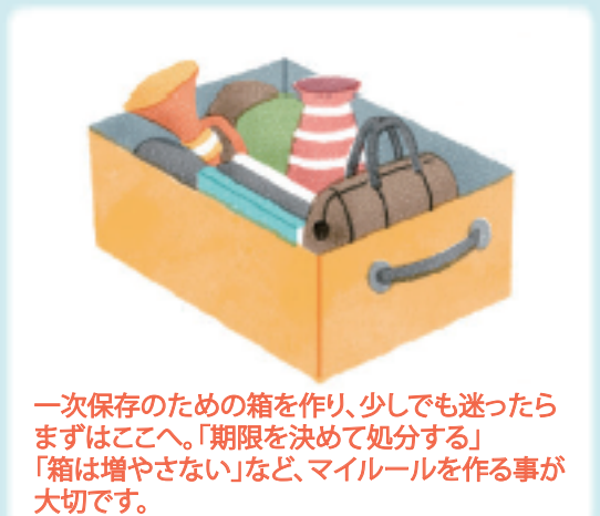
一次保存のための箱を作り、少しでも迷ったらまずはここへ。「期限を決めて処分する」「箱は増やさない」など、マイルールを作る事が大切です。

中には勢いで物を捨てたり、片付けたりして、後悔した経験がある人もいるのではないのでしょうか。長くつかっていない物、いらないかと思った物でも、まずは一時的に別の場所に片付けてみて、捨てるかどうかの見極め期間を持つというのもひとつの手です。半年間、一度も使わなかったら捨てるなど、ルールを決めて実践してみてください。