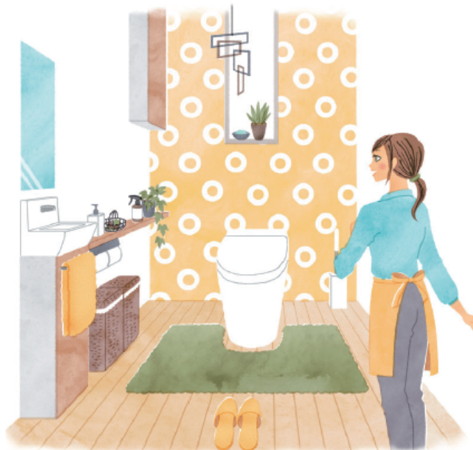
アクセントカラーを単色で取り入れるのもいいですが、北欧系のファブリックなど、カラフルな柄ものにするのもおすすめ。アクセントはバランスが大切ですから多用しすぎに注意しましょう。

まずは小さな空間でアレンジ技を磨き、そのセンスを活用して、自分らしいおしゃれな住まいをつくっていきましょう。