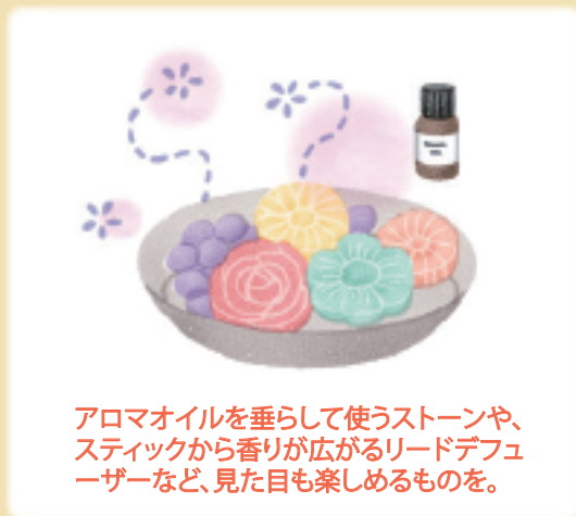
アロマオイルを垂らして使うストーンや、スティックから香りが広がるリードデフューザーなど、見た目も楽しめるものを。

香りには好みがありますから、家族の苦手な香りは避け、みんなが心地よく過ごせるものを選ぶのがベスト。おすすめは、すっきり爽やかなミント系の香りや、せっけんぽ香りなど、清潔感のあるもの。インテリアのテイストに合わせるのもいいですね。