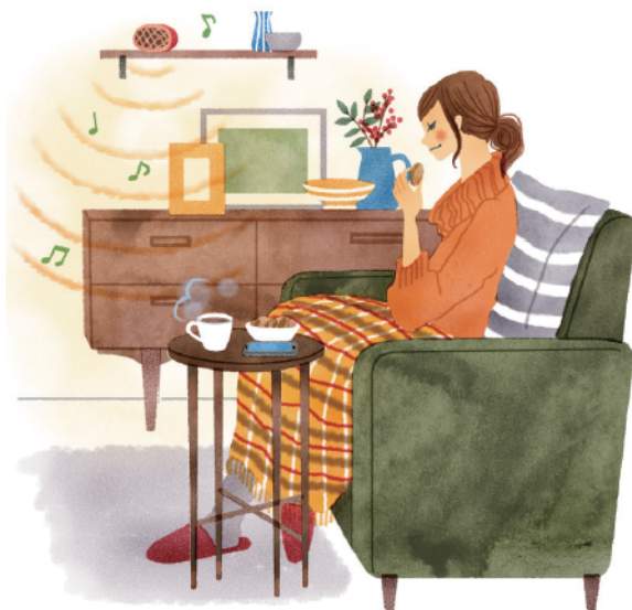
お気に入りの音楽で部屋中をやさしく満たしてみれば、とびきりのリラックスタイムに。自然に笑顔になれるはずです。

部屋で過ごす時間のぐっと増える寒い冬。インドアのひとときを彩る、素敵なBGMのある暮らしを始めませんか。音楽ならヘッドフォンで十分なんて言わないで、「見えないインテリア」として、あえて空間に音を響かせましょう。癒される、心弾む、元気になる……、心地よい音楽があれば、自然に気分もよくなります。お気に入り曲をBGMに、くつろげる空間作りをしてみましょう。