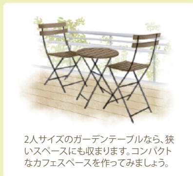
2人サイズのガーデンテーブルなら、狭いスペースにも収まります。コンパクトなカフェスペースを作ってみましょう。

日光の恵みあふれるスペースには、ぜひグリーンを。植物はベランダの向きや日当たりに合わせて選んでください。また、春はベランダ菜園を始めるのにちょうどいい季節。ハーブやかわいい野菜の鉢をウッドシェルフにおしゃれに並べて、目に美しく、しかも美味しいベランダガーデンを楽しんで。